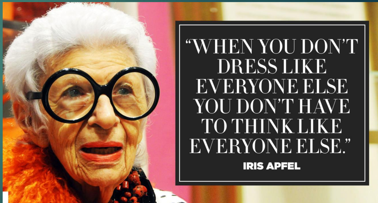
Iris Apfel 1921-2024